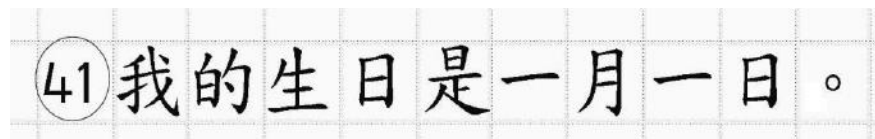
Рис.14. Образец написания иероглифических знаков

иероглифический знак и каждый знак препинания следует писать внутри отдельной клетки области ответов бланка ответов № 2 (дополнительного бланка ответов № 2) (рис. 14).